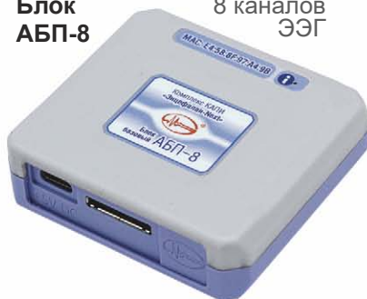
Коннектор Поли-8 с блоком АБП-8