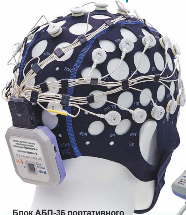
Блок АБП-36 портативного электроэнцефалографа с гарнитурой (на текстильном эластичном шлеме)