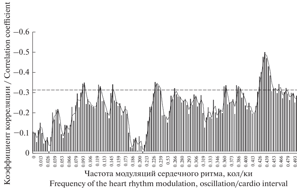
Рис. 1. Связь периодограммы сердечного ритма на различных частотах (колебаний на кардиоинтервал) с уровнем десинхронизации ЭЭГ в левом центральном отведении при выполнении КФП “Часы с поворотом”. Штриховая линия – уровень достоверности корреляции больше 95%.

Fig. 1. Correlations between periodogram of heart rhythm on various frequencies (oscillation/cardio interval) and levels of EEG desynchronization in the left central lead in the psychophysiological test – “Clock with a turn”. The note: the dashed line - the level of significance of correlation is more than 95%.