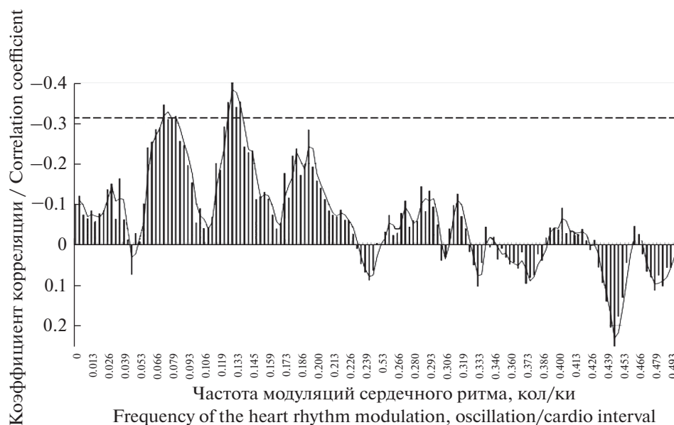
Рис. 3. Связь периодограммы сердечного ритма на различных частотах (колебаний на кардиоинтервал) с уровнем десинхронизации ЭЭГ в левом центральном отведении при выполнении КФП “Устный счет”. Штриховая линия – уровень достоверности корреляции больше 95%.

Fig. 3. Correlations between periodogram of heart rhythm on various frequencies (oscillation/cardio interval) and levels of EEG desynchronization in the left central lead in the psychophysiological test – “Mental arithmetic”. The note: the dashed line - the level of significance of correlation is more than 95%.