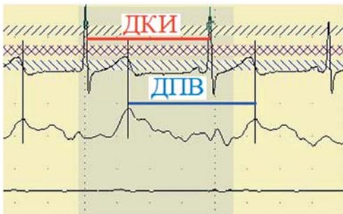
Рис. 1. Пример синхронной записи кардиоинтервалов (сверху) и пульсовых волн (снизу). Красной линией обозначена ДКИ — длительность кардиоинтервала между соседними R пиками, а синей линией показана ДПВ — длительность пульсовой волны между соседними пиками волны пульса.

Коэффициент наклона аппроксимирующей прямой, обозначенный нами как T_n , максимальное значение которого равно единице, показывает, насколько зависимость между ДКИ и ДПВ приближается к идеальной прямой. Соответственно, чем больше коэффициент наклона, тем больше степень совпадения между ДКИ и ДПВ, и наоборот: чем больше значение данного показателя, тем меньше степень совпадения ДКИ и ДПВ. Высокую степень совпадения ДКИ и ДПВ можно определить, во-первых, на основе приближения значения коэффициента наклона к единице, во-вторых, по приближению значения коэффициента смещения к нулю. Соответственно, при-