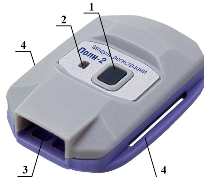
Рисунок 1 – Модуль регистрации Поли-2

ВНИМАНИЕ! 1. Если присутствует активное подключение модуля по беспроводному каналу через один из типов интерфейсных блоков Комплекса и светодиодный индикатор непрерывно горит синим цветом, выключение модуля невозможно. Для выключения модуля необходимо снять активное подключение и удерживать кнопку нажатой более 2 и менее 10 секунд. В режиме активного подключения многофункциональная кнопка имеет только функцию постановки маркера.