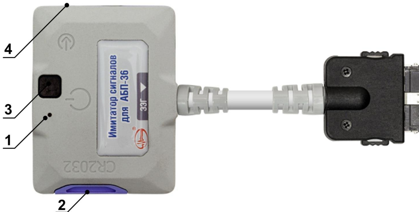
Рисунок 2 – Внешний вид имитатора сигналов ИС-36

Внешний вид ИС представлен на рисунке 2, где: (1) – светодиодный индикатор, (2) – батарейный отсек, (3) – многофункциональная кнопка, дополнительно отмечена символом \odot , (4) – разъём для подключения внешнего генератора сигналов, дополнительно отмечен символом \oplus .