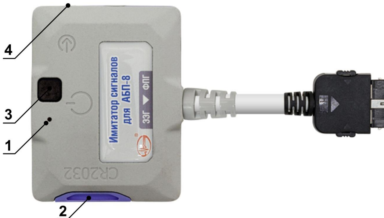
Рисунок 2 – Внешний вид имитатора сигналов для АБП-8

Внешний вид ИС представлен на рисунке 2, где: (1) – светодиодный индикатор, (2) – батарейный отсек, (3) – многофункциональная кнопка, дополнительно отмечена символом ⏻, (4) – разъем для подключения внешнего генератора сигналов, дополнительно отмечен символом ⊕.