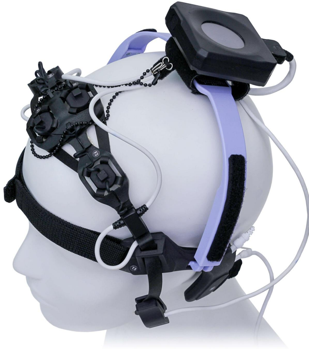
Рисунок 7 – Пример использования ПТ-гарнитуры с блоком АБП-8-И

Также в комплект могут входить ПТ-гарнитуры с электродами для твердого геля (рис. 7).