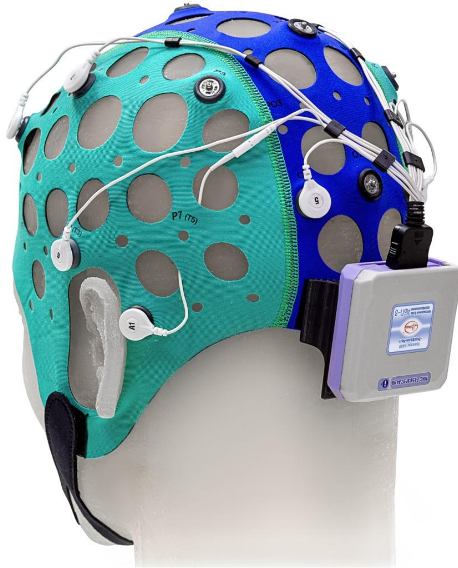
Рисунок 1 – Пример использования ТЭШ-гарнитур ЭЭГ-8

Гарнитур для АБП-8 – это тканевые шлемы и пластиковые нейрогарнитур, которые подключаются к базовому блоку АБП-8. Пример ТЭШ-гарнитур приведен на рисунке 1.