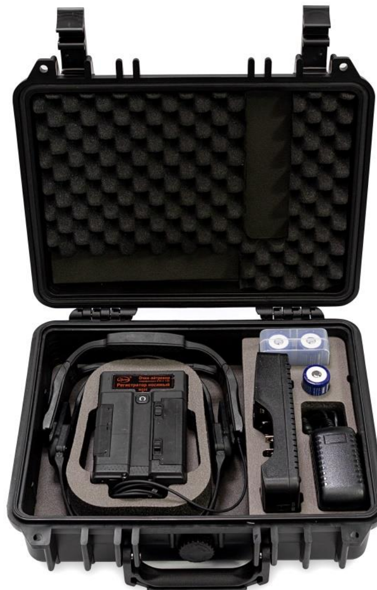
Фото справа: Кейс для транспортировки комплекта поставки очков-айтрекера АТВ-2, включающего в себя все необходимые компоненты (сенсорные очки, регистратор данных, зарядное устройство, целеуказатель калибровки).

Фото слева: Конструкция сенсорных очков для айтрекера реализована таким образом, что они могут беспрепятственно использоваться для людей, носящих свои коррекционные очки с диоптриями.