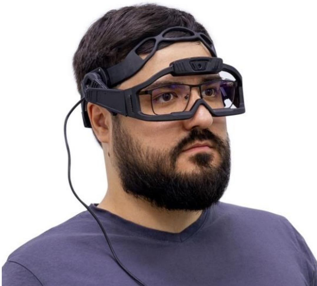
Фото слева: Конструкция сенсорных очков для айтрекера реализована таким образом, что они могут беспрепятственно использоваться для людей, носящих свои коррекционные очки с диоптриями.