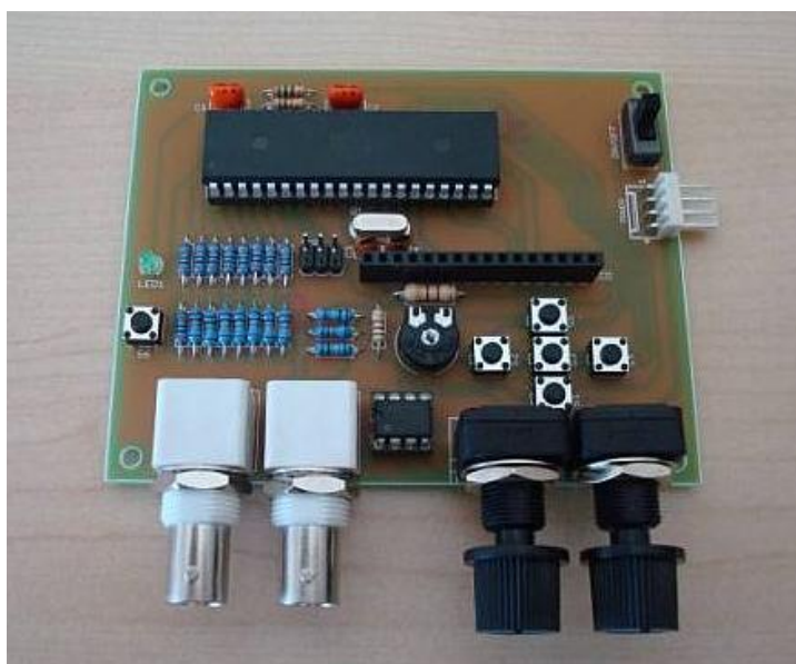
Рис. 3. Макет функционального DDS -генератора сигналов произвольной формы

На рис. 3 представлен рабочий макет функционального DDS -генератора сигналов произвольной формы.